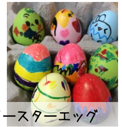
イースターエッグ