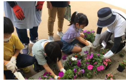
開館1年目から続いている「お花クラブ」では、学年を超えた交流が生まれています。今年からは「野菜クラブ」も結成。児童館入口の花壇がどうなっていくか、お楽しみに。