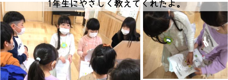
じどうかん探検。2年生が児童クラブの使い方を1年生にやさしく教えてくれたよ。