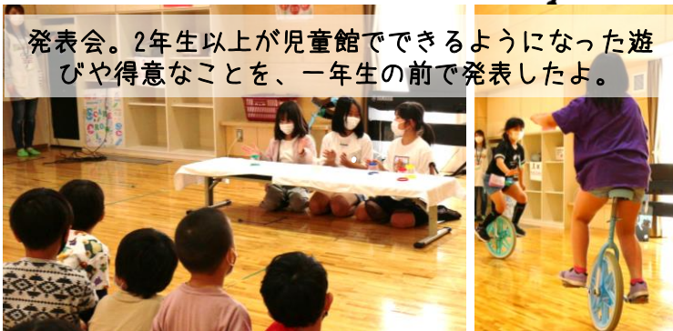
発表会。2年生以上が児童館でできるようになった遊びや得意なことを、一年生の前で発表したよ。