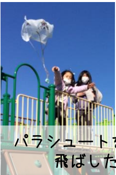
パラシュートを作って飛ばしたよ