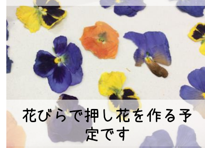
花びらで押し花を作る予定です