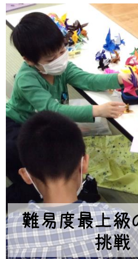
レゴのロボットで対決だ!