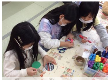
ブンブンゴマを作ったよ