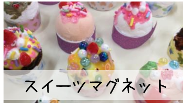
スイーツマグネット