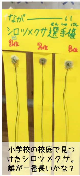
小学校の校庭で見つけたシロツメクサ。誰が一番長いかな?