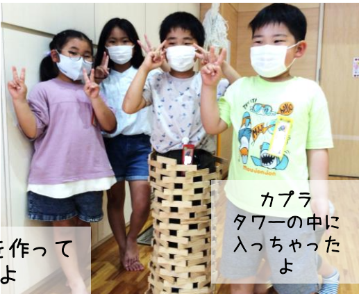
カプラタワーの中に入っちゃったよ